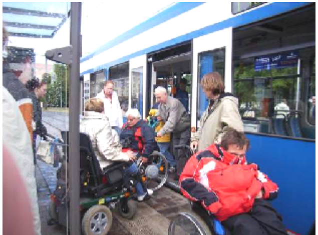
Barrierefreie Straßenbahnen verkehren in ganz Rostock