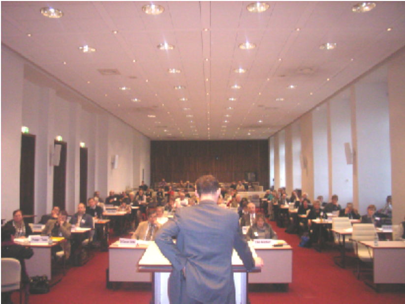
Interessenvertretung im Plenarsaal