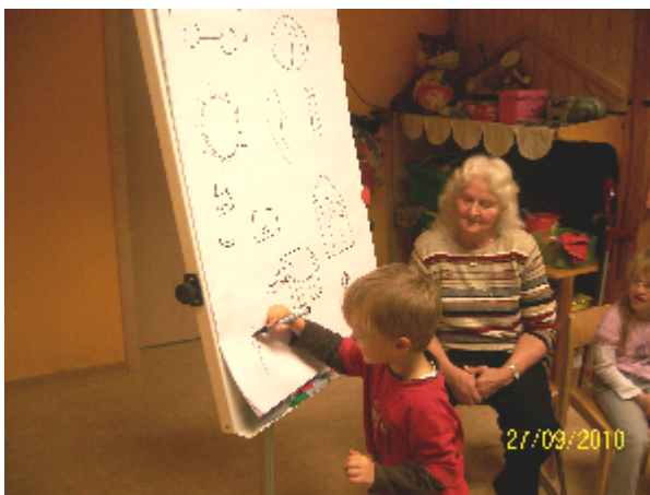
Jeder malt sein eigenes Lieblingsbild an die Tafel