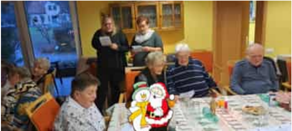
Weihnachtssingen mit den Mitarbeitern vom Ambulanten Pflegedienst