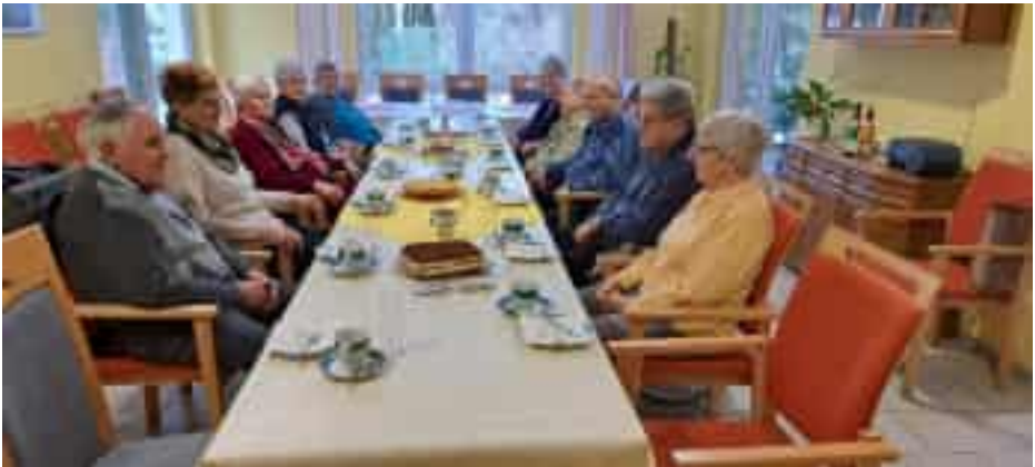
Unsere Geburtstagskinder vom Monat November und Dezember 2023.