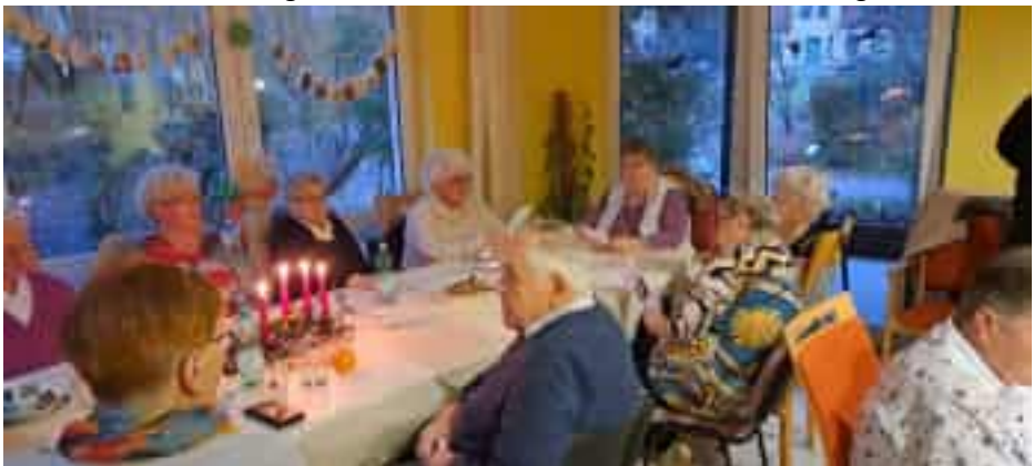
Die Hausbewohner in gemütlicher Runde