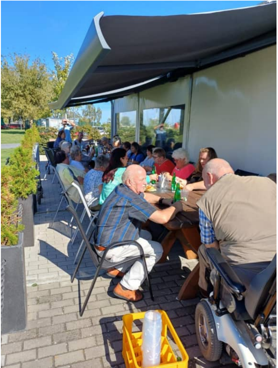
Gemeinsames Mittagessen mit den Freunden aus dem Behindertenverband Ueckermünde Fisch essen in der „Fischoase“