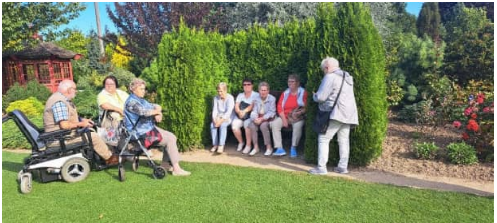
Hier Ruhen sich die Mitglieder in kleinen Nischen erstmal aus, bevor der Spaziergang weiter geht.