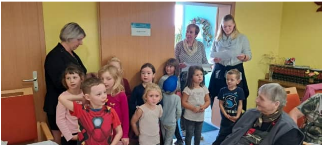
Die Kinder vom Märchenwald erfreuten unsere Mitglieder, mit Liedern, Gedichten „Rund um den Geburtstag“.