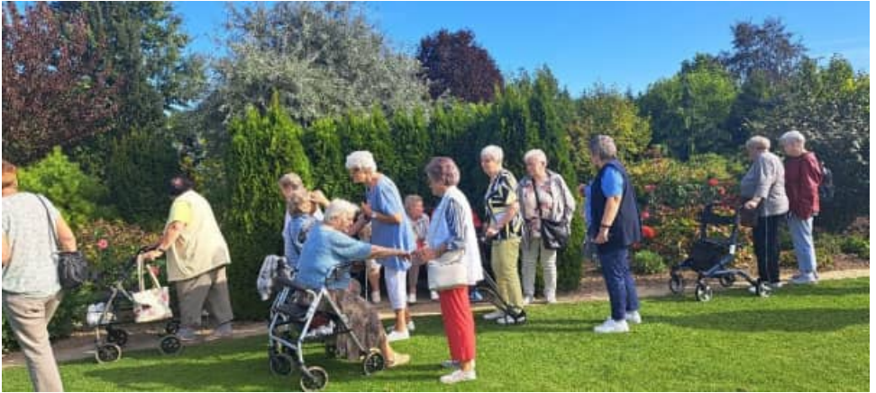
Mitglieder beim Rundgang bei der Besichtigung der angelegten Beete, Pflanzen, Sträucher und Rosen.